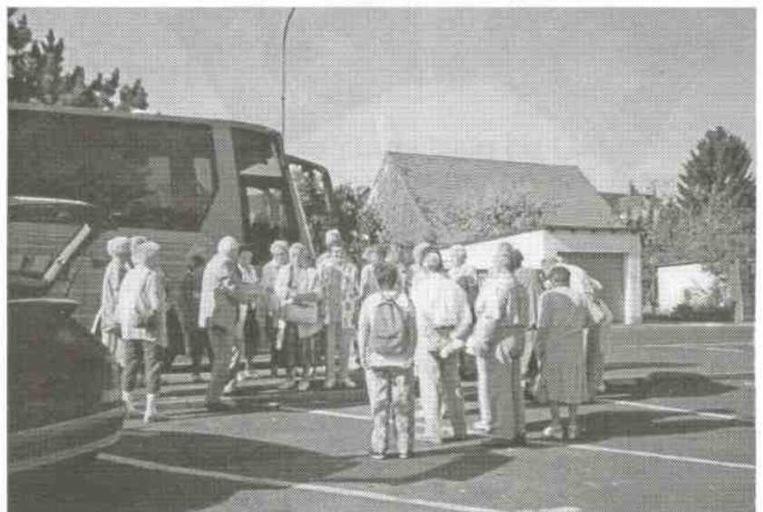
Das Bild zeigt die HGV-Reisegruppe vor ihrem Reisebus in Melsungen.

Erwähnt soll noch werden, daß uns ein sehr angenehmer, moderner Bus zur Verfügung stand, dessen Obergeschoß an dem schönen Tag eine herrliche Aussicht über das hessische Bergland erlaubte.