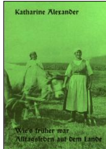
Katharine Alexander, „Wie's früher war - Alltagsleben auf dem Lande“, 67 Seiten, gebunden, Preis 6 €.