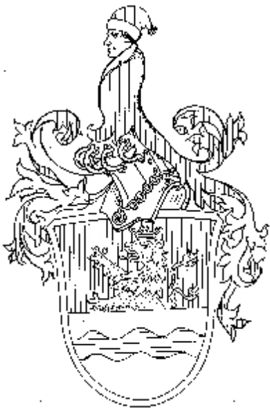
Wappen des Geschlechts von Windhausen