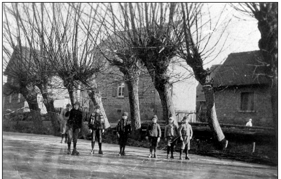
.... oder Eislaufen auf der zugefrorenen Wiesek

Himmelsrichtung kamen dann im neuen Jahr die schweren Gewitter her. In der Neujahrsnacht versuchte man, das Wetter für die kommenden zwölf Monate zu bestimmen. Von einer Zwiebel wurde die Schale entfernt. Zwölf Ringe der Zwiebel stellten die Monate des Jahres dar. Auf die Ringe wurde