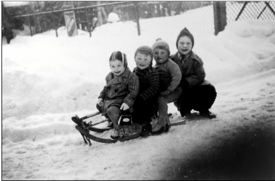
Die Winterfreuden der Kinder: Schlittenfahren auf der Schlittenbahn....

Aktion, die nur während des Abendläutens der Glocken erfolgte, sollte im kommenden Jahr eine reiche Obsternte bewirken. Während des Strohbindens durfte nicht gesprochen werden. Um einen Erfolg zu bekommen, verrichteten manche Gartenachbarn wortlos ihre Arbeit.