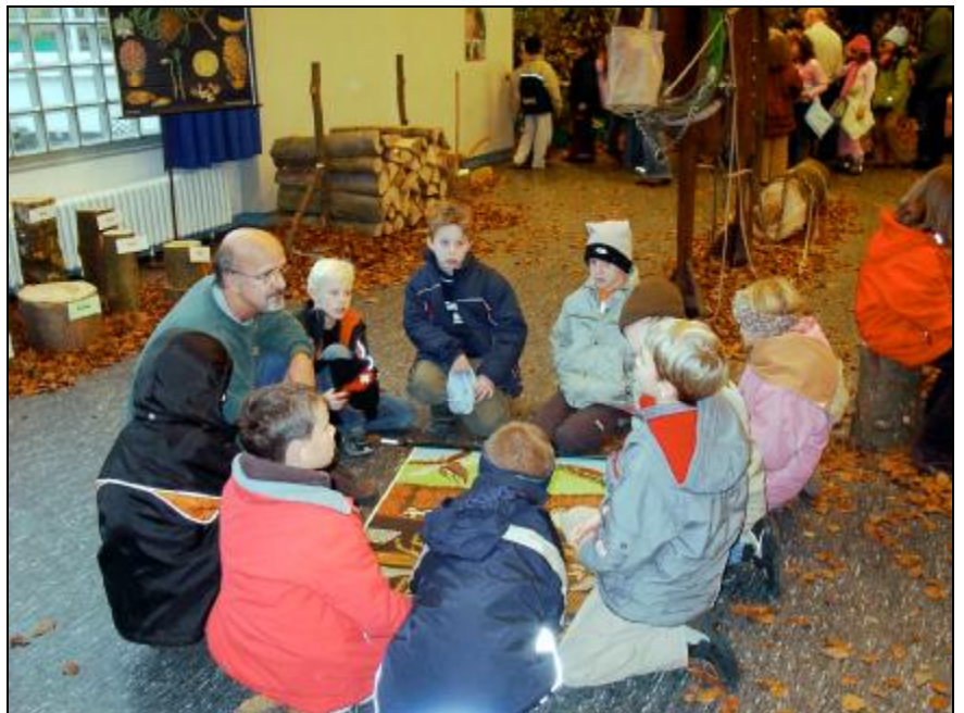
Schule im Bürgerhaus - Grundschüler der Kirschberg-Schule besuchten auch in diesem Jahr unsere Jahresausstellung